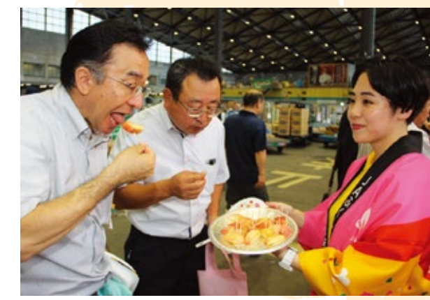
福島の桃をPRする学生