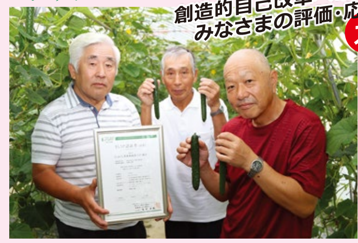
GAPきゅうりをPRする生産者

創造的自己改革へのさらなる挑戦!! みなさまの評価・応援が私たちの力になります!