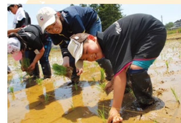
子ども達は楽しく真剣に参加していました

第1回は田植えとBBQ。第2回はダシの科学と食農学類見学。第3回に稲刈り、第4回は収穫したお米で「ニコニコおむすび大作戦」を実施します。