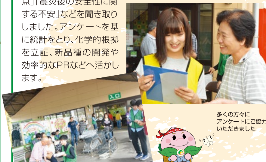
多くの方々にアンケートにご協力いただきました

農産物直売所こころ吾妻店で「福島県産モモおよびナシの購入・消費に関するアンケート調査」を実施。福島市、福島県産の農産物の購入・消費の実態や消費者ニーズを把握し今後の産地づくりに活かすことを目的として、直売所へ訪れた消費者を対象に「モモ・ナシの購入場所」「購入の際重視する点」「震災後の安全性に関する不安」などを聞き取りました。アンケートを基に統計をとり、化学的根拠を立証、新品种の開発や効率的なPRなどへ活かします。