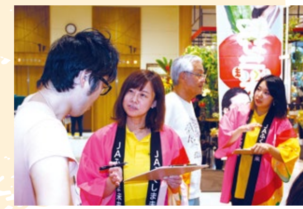
消費者にアンケートの実施