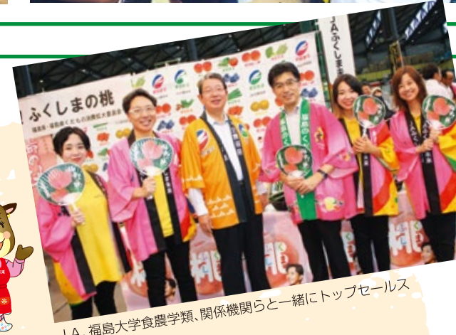
JA、福島大学食農学類、関係機関らと一緒にトップセールス