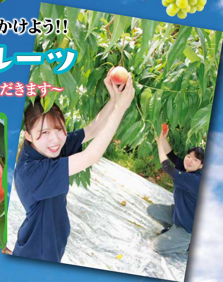
ふくしまのフルーツ 旬なカレンダー