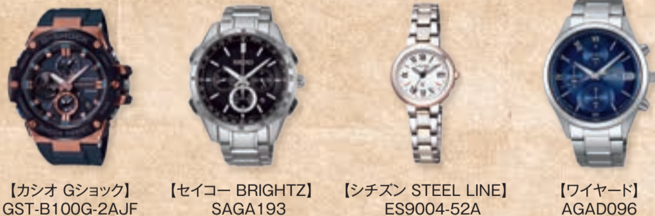
【カシオ Gショック】 GST-B100G-2AJF