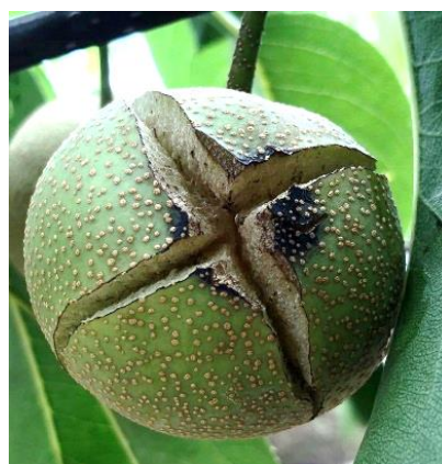
図4 ナシ黒星病の発病果実