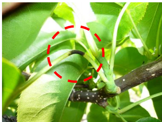
図3 ナシ黒星病の発病葉