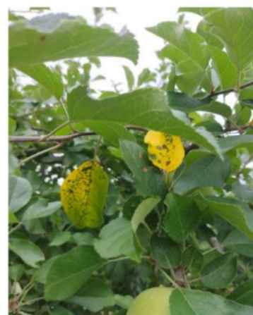
図1 リンゴ褐斑病発病葉 （令和5年7月13日撮影）